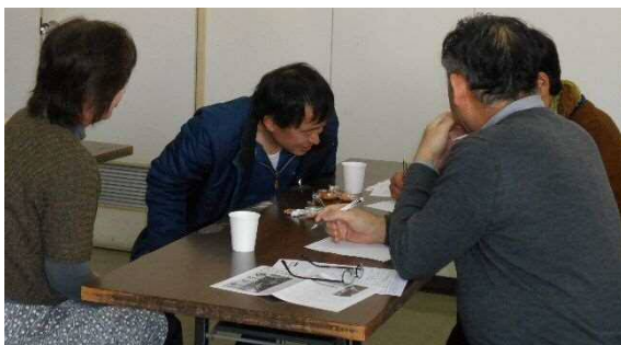
▲筆談で会話を楽しむ参加者

中途失聴難聴者の方からは、「てのひらに字を書いて知らせる時は、漢字で書くよりもひらがなで書いてくれると分かりやすい」「筆談をお願いすると、