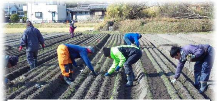
1/26、中川原地域で玉ねぎ苗植えが完了しました。

地域の農家は機械化が進み 1反を半日で機械植えします。 こちらは6人で手植え2日〜